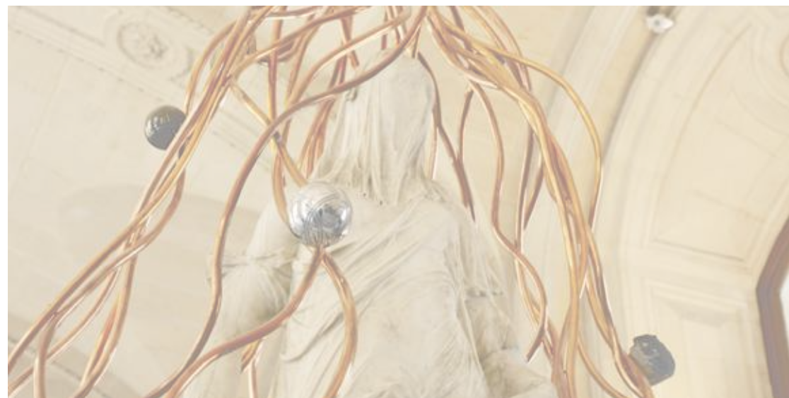
« Douce Douche » (détail), exposition Contrepoint III, De la sculpture, musée du Louvre, Paris, 2007

Au fil de l'étude et des projets, il conjugue la trivialité d'objets domestiques avec des références savantes.