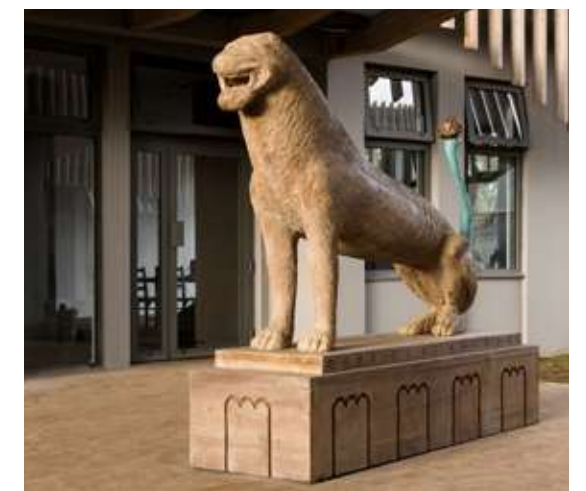
« Caprices de Nairobi », ambassade de France, Nairobi (Kenya), 2017

Un autre contexte de commande, le 1% artistique pour un collège, a engendré une nouvelle proposition inédite dans son travail par la conception d'un service d'assiettes et de plateaux avec décors pour le restaurant scolaire de l'établissement.