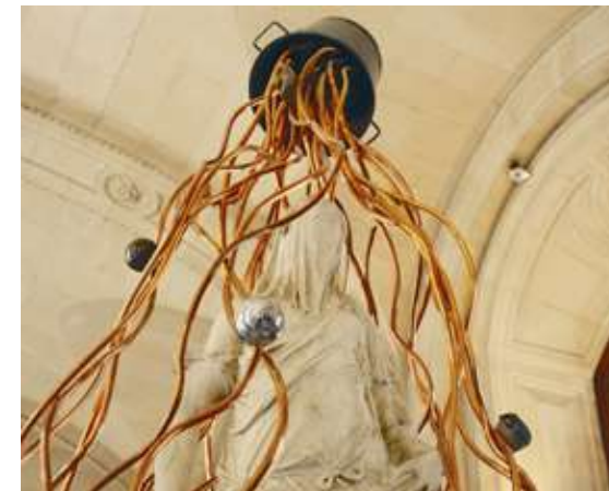
« Douce Douche » (détail), exposition Contrepoint III, De la sculpture, musée du Louvre, Paris, 2007

Le tuyau utilisé pour tracer des lignes, ici en cuivre, se retrouve dans la proposition intitulée « Douce douche », où il vient « couler » sur une statue de Corradini dans la galerie de sculpture italienne du musée du Louvre, dans l'exposition Contrepoint, de la Sculpture qui mettait en dialogue des pièces de la collection du Musée avec la création d'artistes issus de la scène artistique contemporaine.