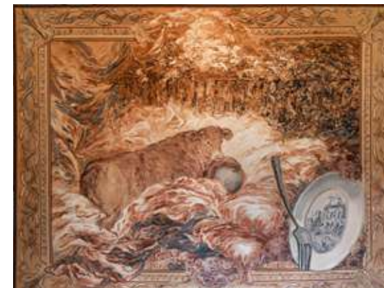
« Hommage au François Boucher », exposition Château de Rambouillet (78), 2013

Le tuyau utilisé pour tracer des lignes, ici en cuivre, se retrouve dans la proposition intitulée « Douce douche », où il vient « couler » sur une statue de Corradini dans la galerie de sculpture italienne du musée du Louvre, dans l'exposition Contrepoint, de la Sculpture qui mettait en dialogue des pièces de la collection du Musée avec la création d'artistes issus de la scène artistique contemporaine.