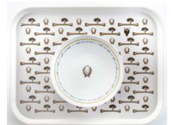
« Sous la purée le dessin », 1% artistique, Collège Julie-Victoire Daubié, Saint-Philibert-de-Grand-Lieu (44), 2015

Un autre contexte de commande, le 1% artistique pour un collège, a engendré une nouvelle proposition inédite dans son travail par la conception d'un service d'assiettes et de plateaux avec décors pour le restaurant scolaire de l'établissement.