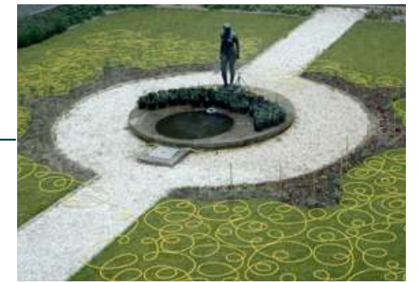
« Équilibre Thermostatique des Motivations », Manifesta 1, Musée Boijmans, Rotterdam, 1996 Équilibre Thermostatique des Motivations, composé de plantations potagères, d'un tuyau et de son tourniquet d'arrosage, sur une surface d'environ 150 m 2 , dans le patio du musée Boijmans.

En 2013, pour une exposition au château de Rambouillet, Didier Trénet a présenté une tapisserie dont l'État lui avait commandé le carton et intitulée « Hommage au François Boucher ». Pour l'installer, sans possibilité de toucher aux murs du château, un dispositif commandé à l'artiste et acquis par le Fonds Régional d'art contemporain d'Ile de France a été conçu à la fois comme une œuvre modulable et comme un support d'œuvre. Déployé pour accrocher la tapisserie, l'ensemble propose une installation inédite.