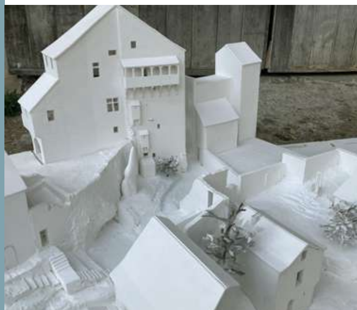
▲ Maquette du projet d'aménagement des abords de la Maison du Gouverneur.

Offre au public les clés de lecture pour comprendre l'histoire et l'évolution de ce territoire, découvrir sa richesse et sa diversité patrimoniales.